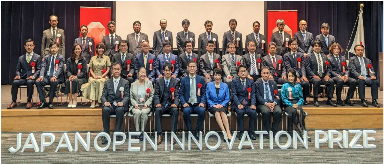
第5回 日本オープンイノベーション大賞 国土交通大臣賞 授賞式